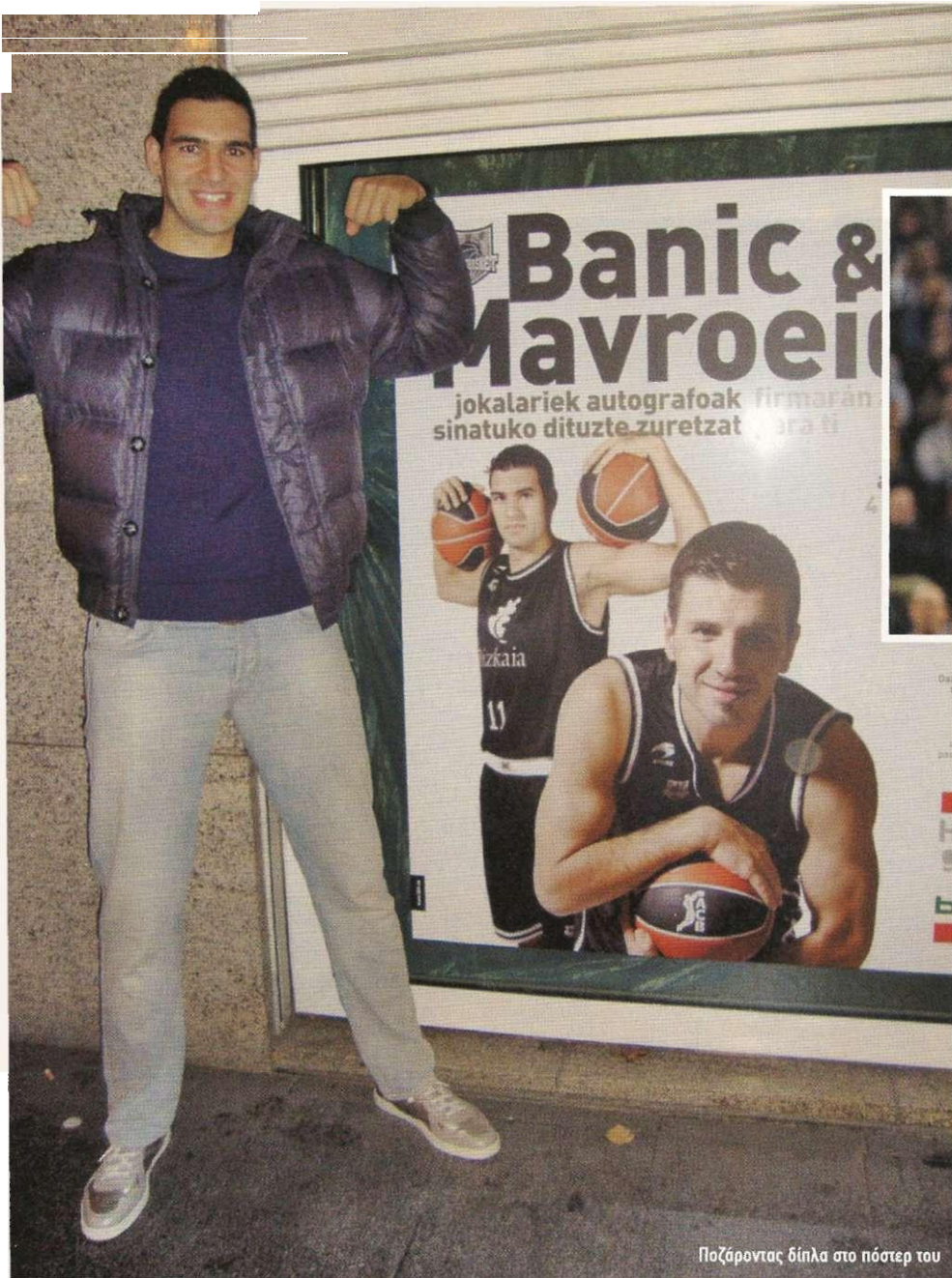
Ποζάροντας δίπλα στο πόστερ του